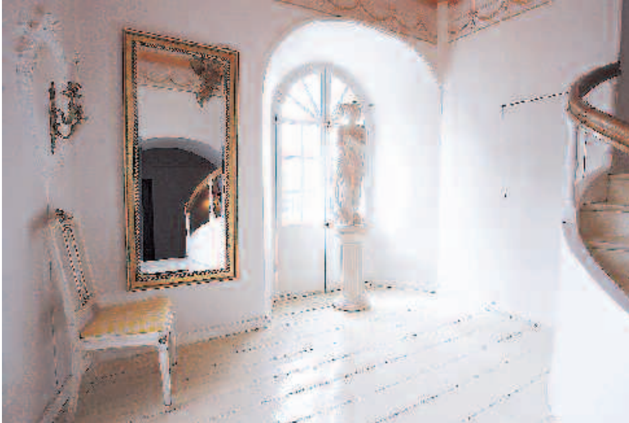
Tesalonen er hvidmalet og holdt i helt enkel stil. Herfra var tidligere en dør ud til terrassen over hovedindgangen.