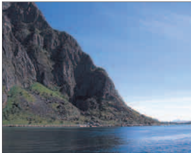
Natur, fjeld og hav kan bl.a. opleves på Seafari i gummibåd. Det siges, at fjeldene i Lofoten har en helt speciel grøn farve.