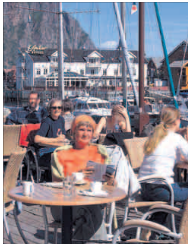
Svolvær er med sine 4.500 fastboende hovedbyen på Lofoten. Her oplever man på havnen en dejlig stemning, hvor folk fra hele verden mødes. Langturssejlere, lokale, turister til lands og Hurtigrutens besøgende nyder solen på en af mole-caféerne.

Målet denne dag var øgruppen Vesterålen med den allernordligste spids på øen Andøya, hvor bygden Andenes ligger. Andenes har ca. 3600 indbyggere og kendes bedst for sine hvalsafarier. Garantien for at se hvaler er så høj, at næste tur er gratis, hvis det ikke lykkes. Fra Andenes er afstanden cirka en times sejlur ud til kanten af fastlandssoklen, og det er her, man kan opleve kaskelothvalerne.