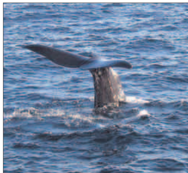
Det sidste man ser af kaskelothvalen, når den dykker ca. 1.000 meter ned i havet, er dens store tvedelte hale. Hvalerne identificeres på formen af deres haler, som kan sammenlignes med menneskers fingeraftryk.

Klima: Juli-august er varmest med middeltemperatur på 12 grader. Højeste temperatur målt er 29 grader. Andøy Turistinformasjon, www.andoyturist.no Whalesafari Andenes, www.whalesafari.com Turist-info: Destination Lofoten, www.lofoten.info Fisketur i midnatssol: www.festvag.no Lofoten Golf Links, www.lofoten-golf.no Å Rorbuer og Vandrerhjem, www.lofoten-rorbu.com